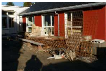
Vue partielle de la nouvelle école

Permanence des élus le jeudi soir de 18h30 à 19h30.