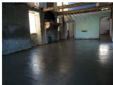
La dalle est coulée