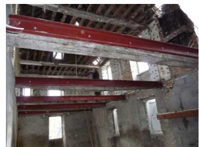
Renforcement des poutres