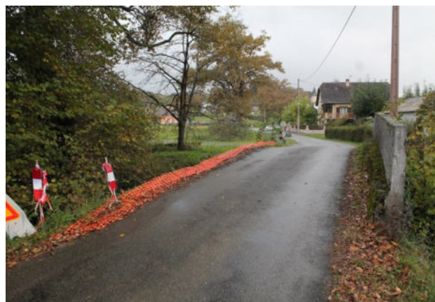
Le pont des Yolettes.

Route Départementale 9 au niveau de la place de la Mairie.