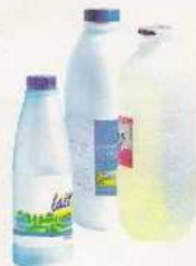
Les bouteilles de lait, de soupe vides