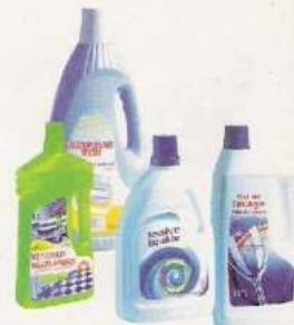
Les bouteilles d'adoucissant de lessive, de liquide vaisselle de javel, de nettoyants ménagers vides