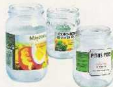
Les bocaux vides de préférence sans couvercle