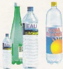
Les bouteilles d'eau, de jus de fruit, de soda vides...