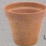
Les pots de fleurs