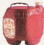
Les cubitainers de vin vides