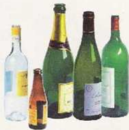
Les bouteilles vides de préférence sans bouchon

Je porte aux containers à verre implantés sur ma commune ou dans les déchetteries :