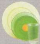
La vaisselle, faïence, porcelaine...