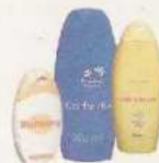
Les flacons de produits de toilette vides