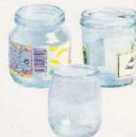
Les pots vides de préférence sans couvercle